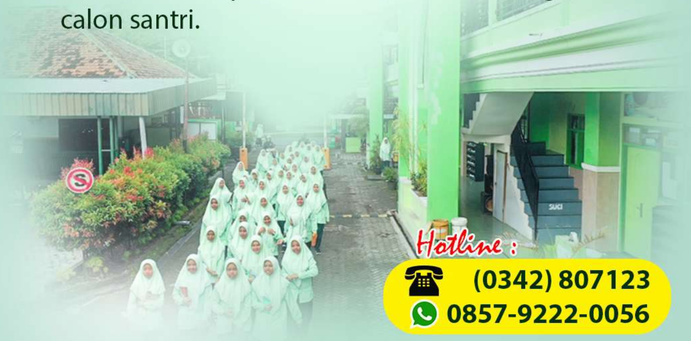
Sungkeman pada momen Hari Guru