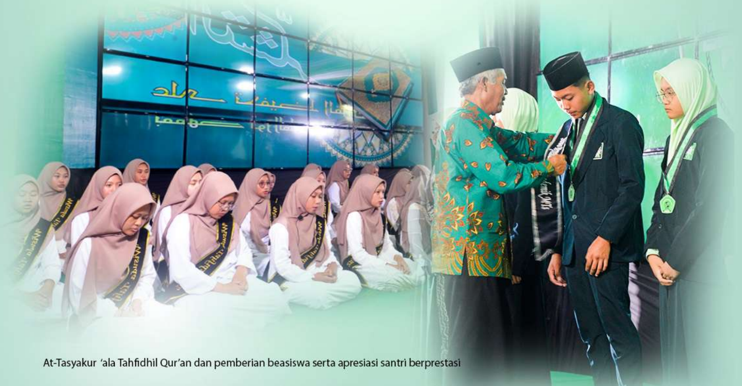
At-Tasyakur 'ala Tahfidhil Qur'an dan pemberian beasiswa serta apresiasi santri berprestasi