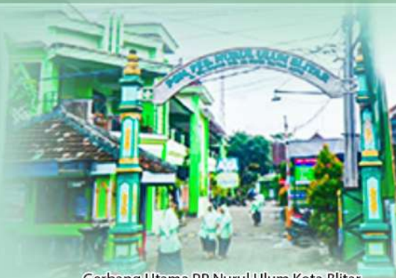
Gerbang Utama PP Nurul Ulum Kota Blitar