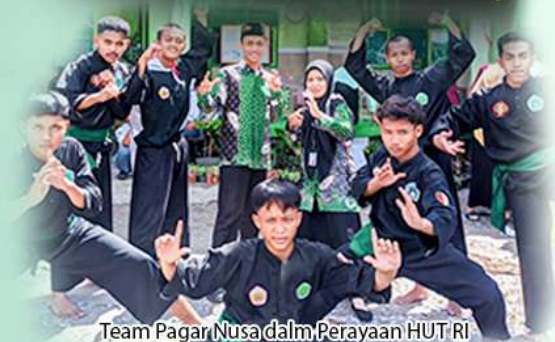
Team Pagar Nusa dalam Perayaan HUT RI