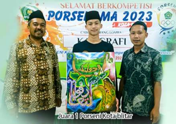
Juara 1 Porseni Kota Blitar

Untuk pengembangan minat bakat para santri, lembaga menyediakan berbagai Kegiatan Pembinaan Karakter Santri dalam pembelajaran Ekstra Kurikuler antara lain :