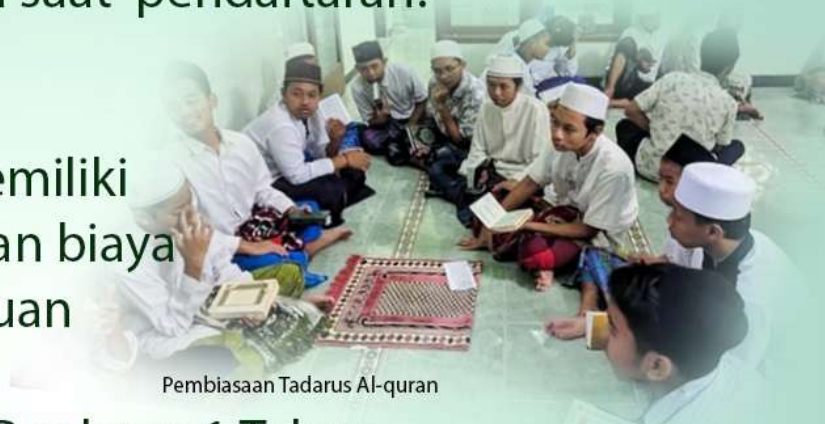
Pembiasaan Tadarus Al-quran