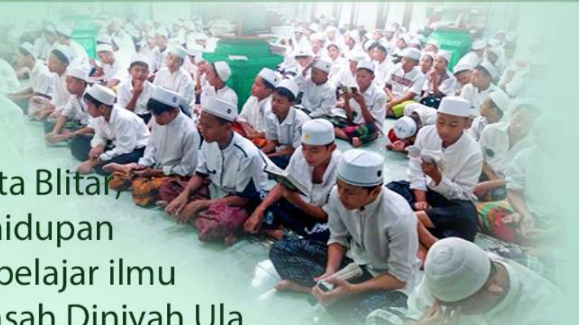
Sholat Berjamaah dan Tadarus Al-Quran sebagai pembiasaan serta penanaman karakter

Penerapan sistem Boarding School santri harus tinggal di Pondok Pesantren Nurul ulum Kota Blitar, untuk dibina perilaku kehidupan kesehariannya. Kegiatan belajar ilmu agama, disediakan Madrasah Diniyah Ula dan Wustho Nurul Ulum.