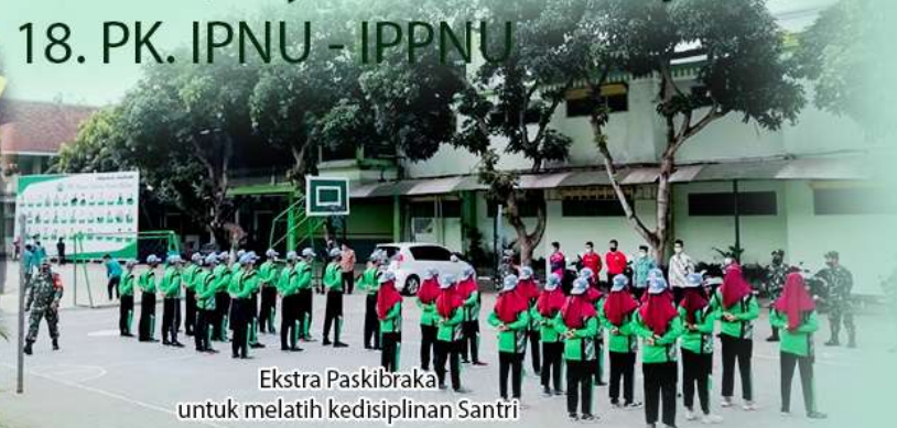
Ekstra Paskibra untuk melatih kedisiplinan Santri