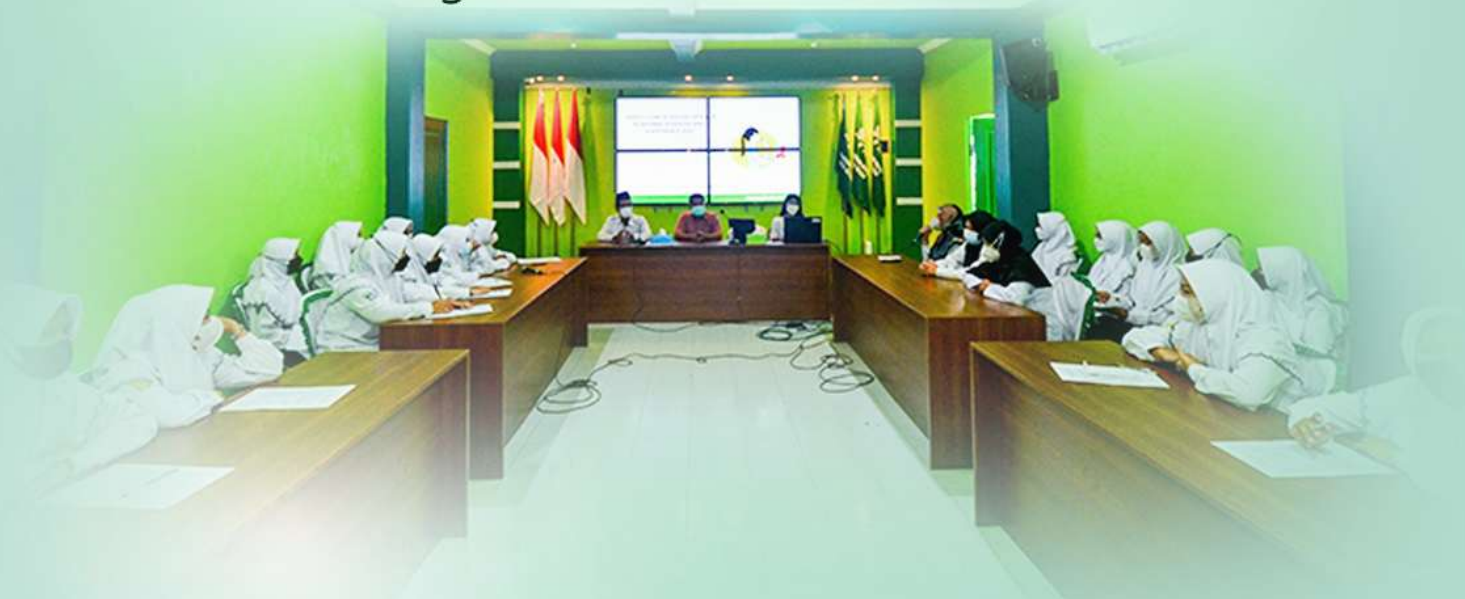
Kegiatan Seminar sebagai tambahan pengetahuan

Di tingkat Madrasah Aliyah terdapat 3 pilihan jurusan, yaitu Agama, IPA dan IPS serta Program pilihan Penguatan Keterampilan (MA Plus Keterampilan), yaitu Tahfidz, Bahasa, TKJ, tata busana, tata boga, budidaya ikan air tawar & Kitab kuning. Pengembangan Minat dan Bakat untuk para santri disediakan berbagai macam Ekstra Kurikuler.