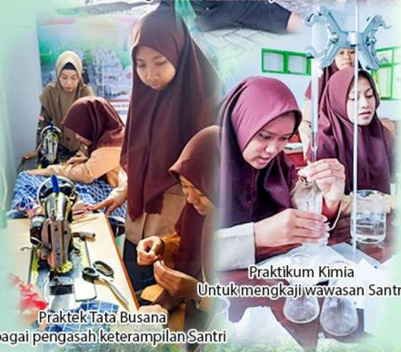
Praktikum Kimia Untuk mengkaji wawasan Santri