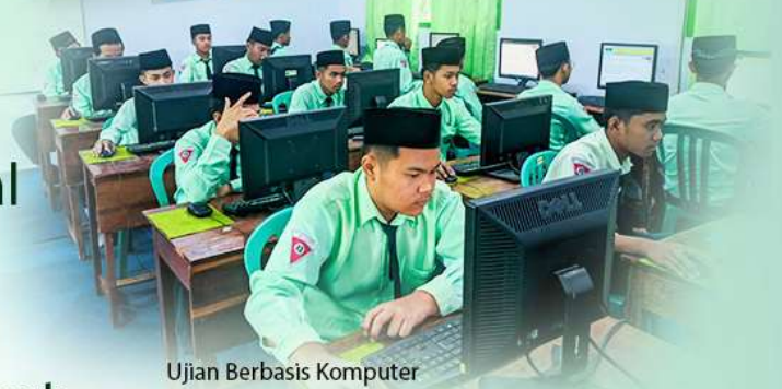
Ujian Berbasis Komputer