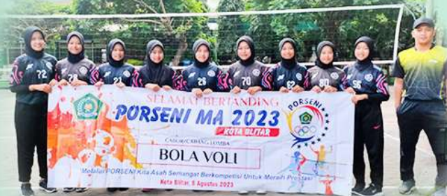
Team Bola Voli Putri