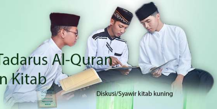
Diskusi/Syawir kitab kuning