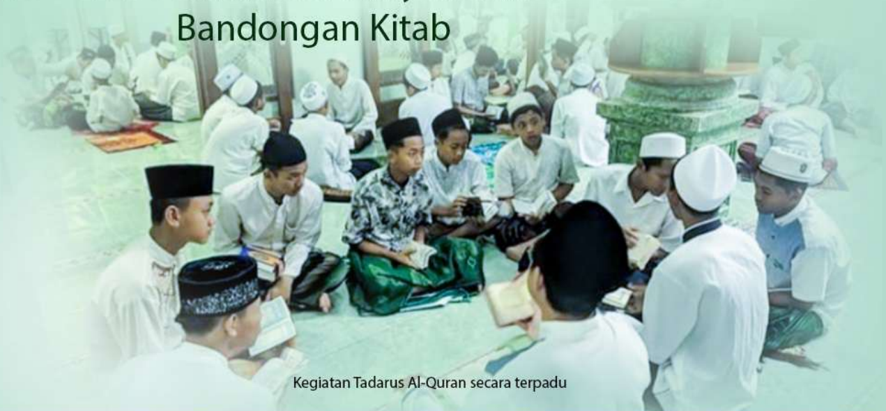
Kegiatan Tadarus Al-Quran secara terpadu