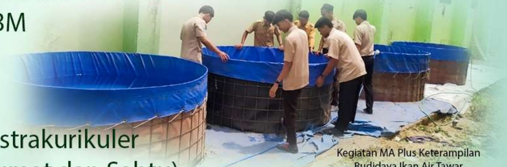
Kegiatan MA Plus Keterampilan Budidaya Ikan Air Tawar

18.30 – 21.00 Madrasah Diniyah dan Bandongan Kitab