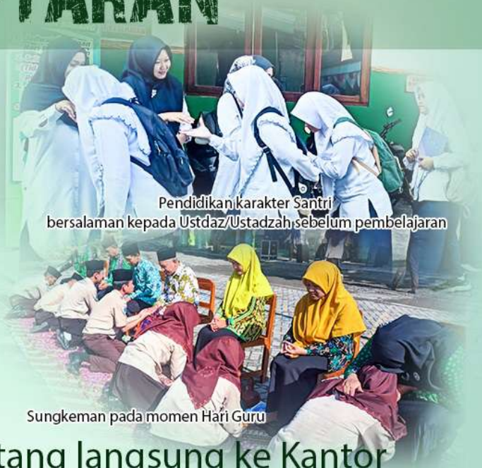
Pendidikan karakter Santri bersalaman kepada Ustadz/Ustadzah sebelum pembelajaran