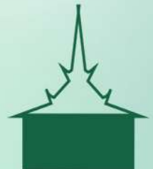
Makam Bung Karno

Jln. Ciliwung No.56 Kepanjenkidul Kota Blitar