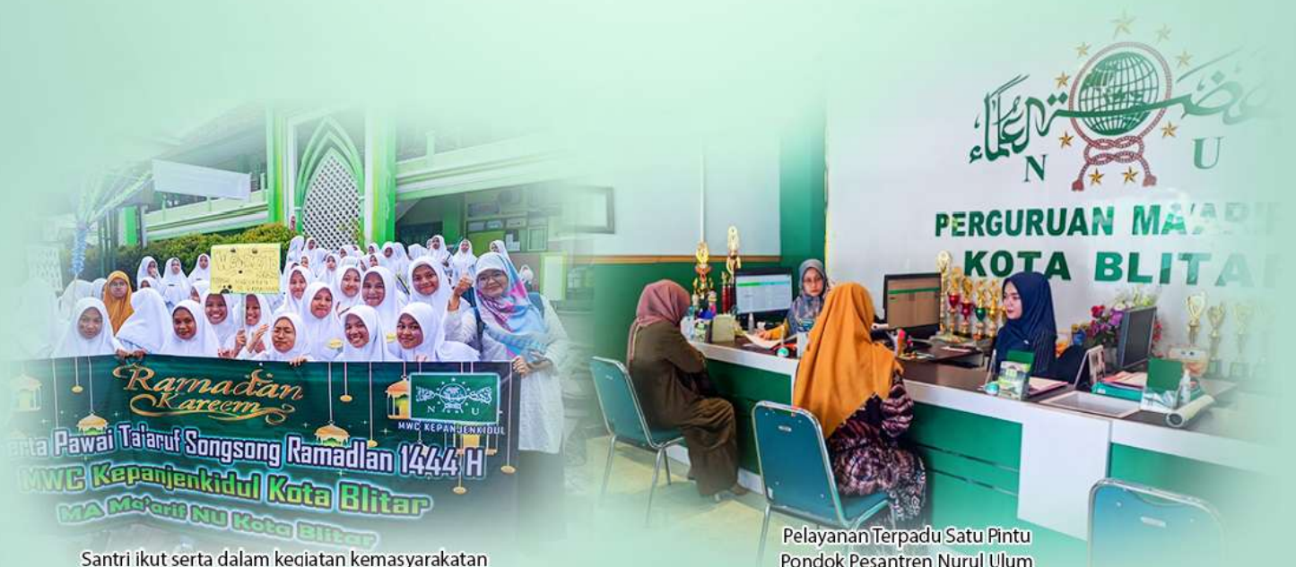
Santri ikut serta dalam kegiatan kemasyarakatan

(setelah transfer mohon untuk segera konfirmasi panitia)