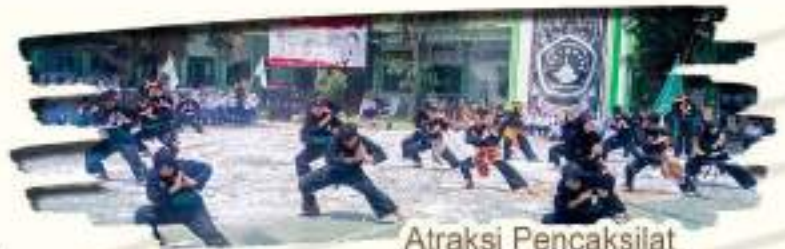
Atraksi Pencak Silat