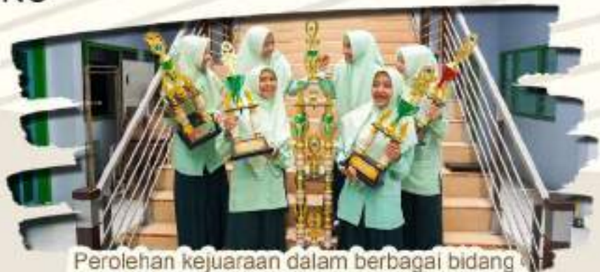
Perolehan kejuaraan dalam berbagai bidang tingkat lokal maupun Nasional