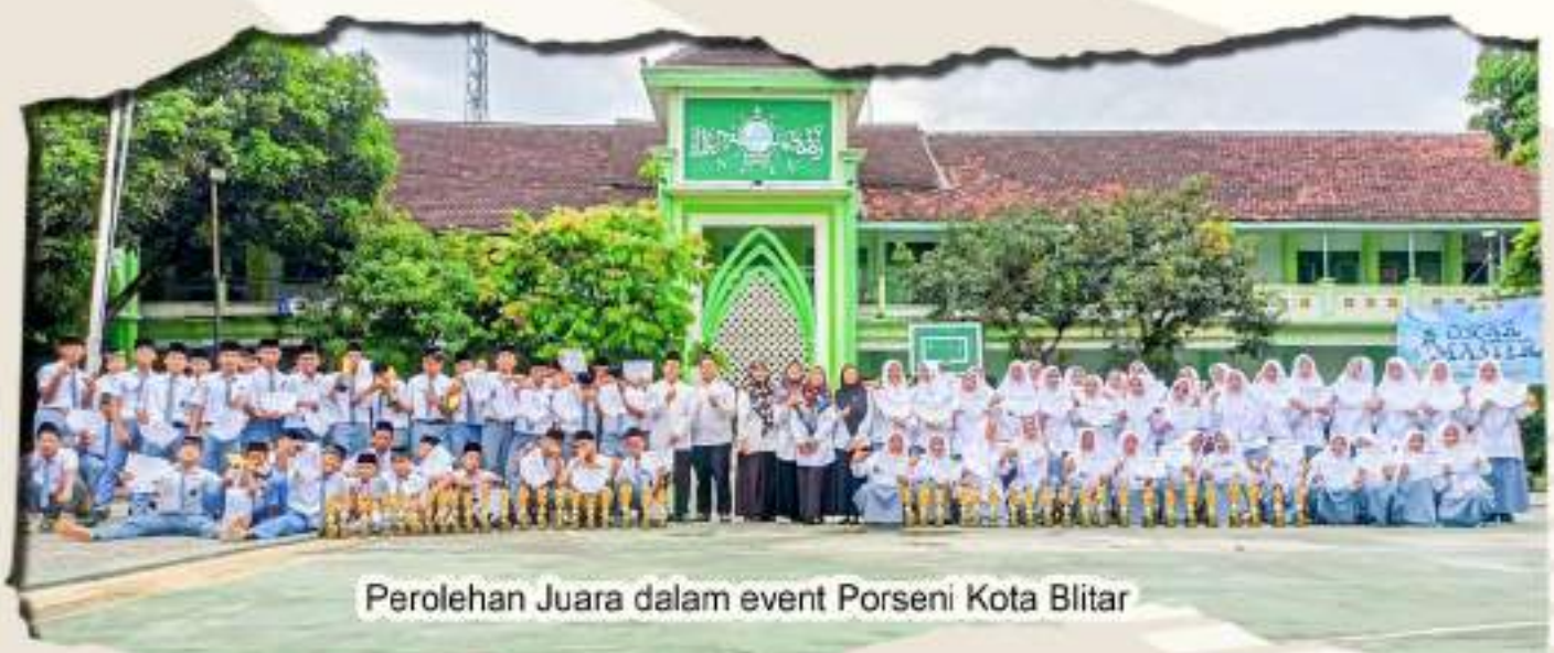
Perolehan Juara dalam event Porseni Kota Blitar