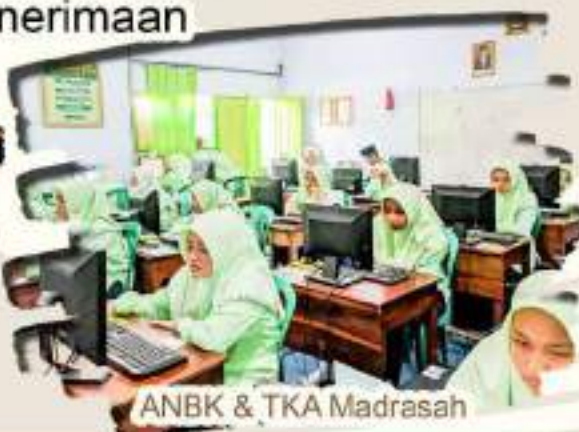
ANBK & TKA Madrasah