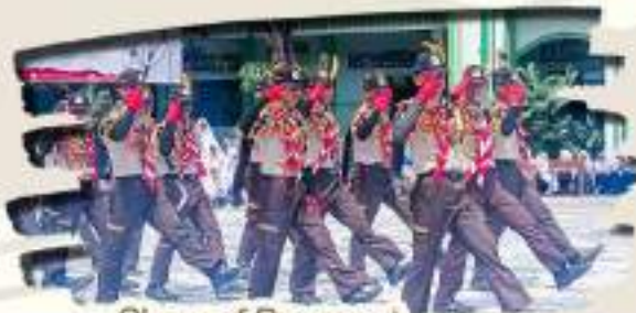
Show of Boy Scout