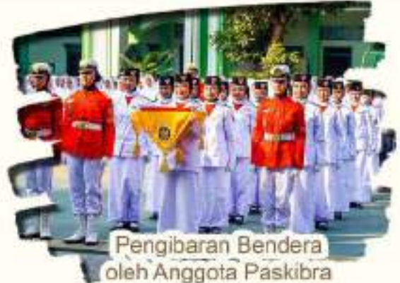
Pengibaran Bendera oleh Anggota Paskibra