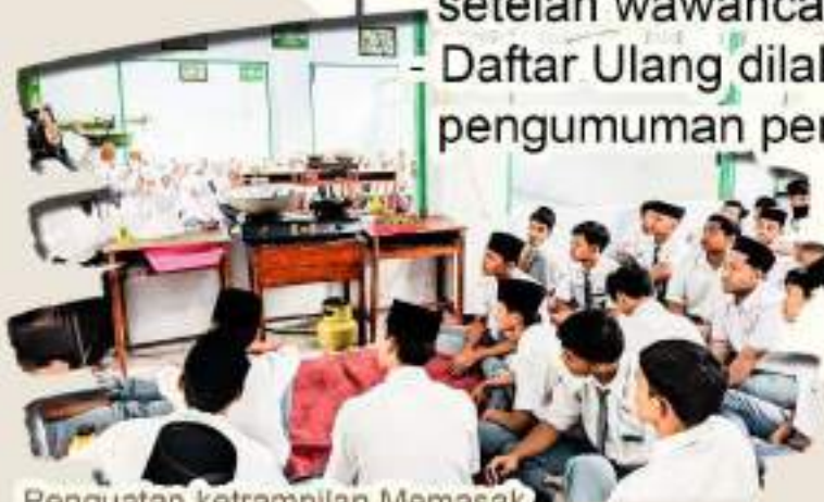
Penguatan ketrampilan Memasak pra Khidmah Santri