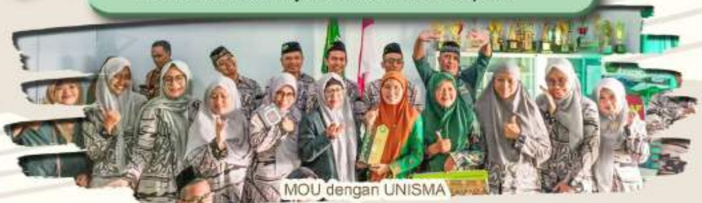
MOU dengan UNISMA

Merupakan hal penting untuk dilakukan agar siswa dapat menemukan potensi dirinya dan memanfaatkannya untuk masa depan.