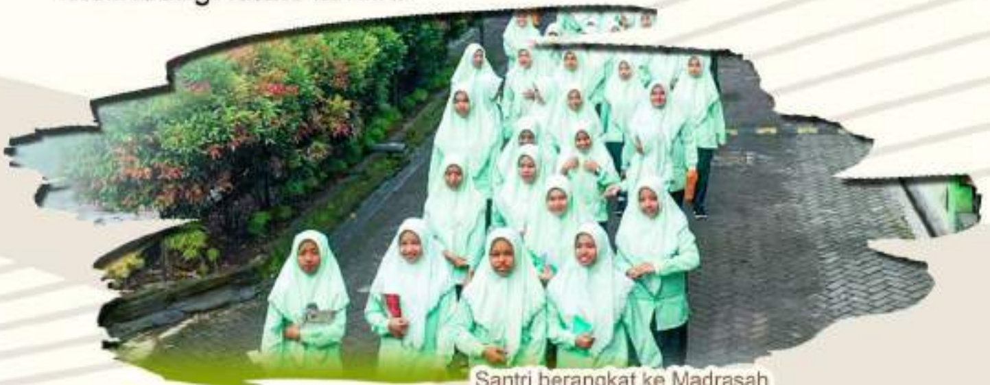
Santri berangkat ke Madrasah

Demikian, Semoga bermanfaat dan Allah SWT selalu melindungi kita. Aamiin.