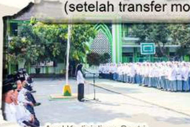
Apel Kedisiplinan Santri