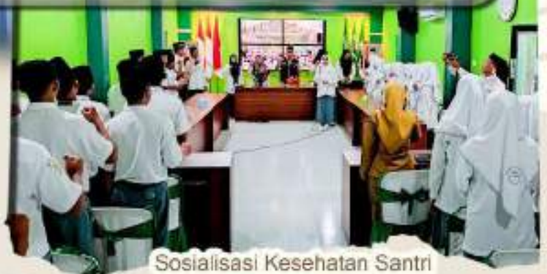
Sosialisasi Kesehatan Santri